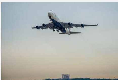
Départ du dernier vol 747 de Delta aux États-Unis

Depuis les années 1970, le 747 est l'avion le plus célèbre au monde mais son ère est à présent révolue. Le Delta Ship 6314 s'est envolé une dernière fois le 4 janvier avant de prendre sa retraite au Pinal Air Park à Marana en Arizona, réalisant ainsi le dernier vol d'un 747 opéré par une compagnie aérienne américaine..