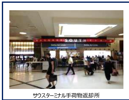
サウスターミナル手荷物返却所