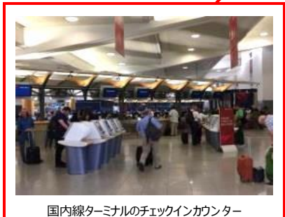
国内線ターミナルのチェックインカウンター