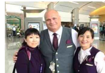
日本語アシストサービスチーム