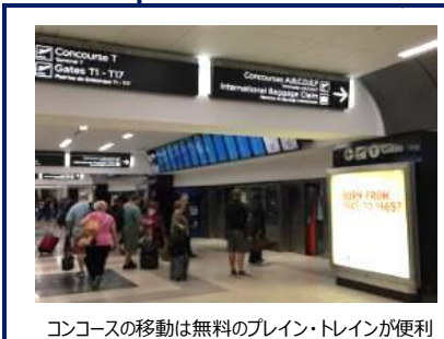
コンコースの移動は無料のブレイン・トレインが便利