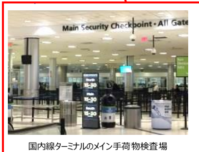
国内線ターミナルのメイン手荷物検査場