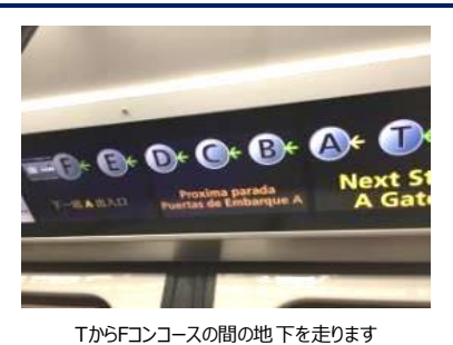
TからFコンコースの間の地下を走ります