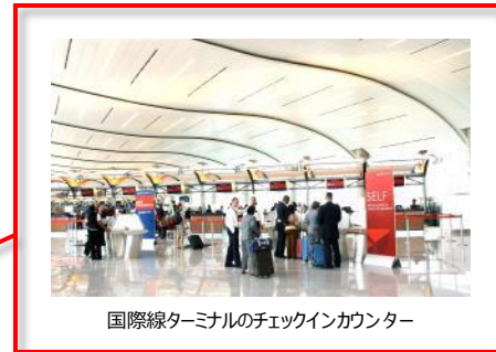
国際線ターミナルのチェックインカウンター